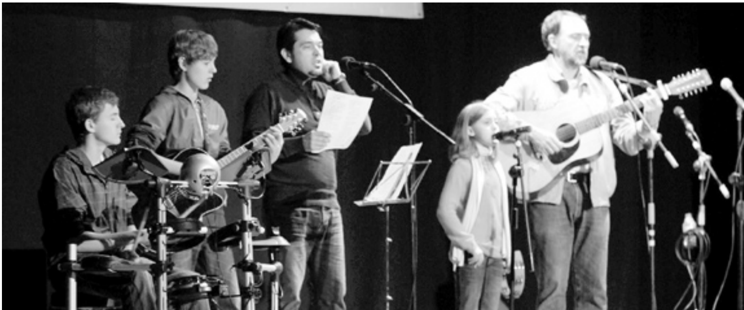
Imagen de archivo de una de las actuaciones de la pasada edición. D.A.